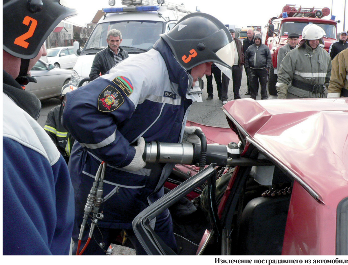
Извлечение пострадавшего из автомобиля

С начала 2020 года и до середины декабря в районе было зарегистрировано 163 пожара, в результате которых получили травмы 3 человека, спасено 23, эвакуировано 51 гражданин. Кроме того, сохранено материальных ценностей на