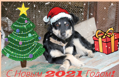
С Новым 2021 Годом!

Приют содержится за счет благотворительных пожертвований.