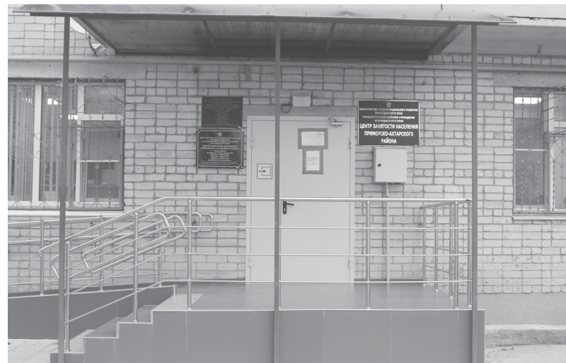
ЦЗН расположен по адресу: г. Приморско-Ахтарск, ул. Братская, 72

Т.ПТИЧКИНА.